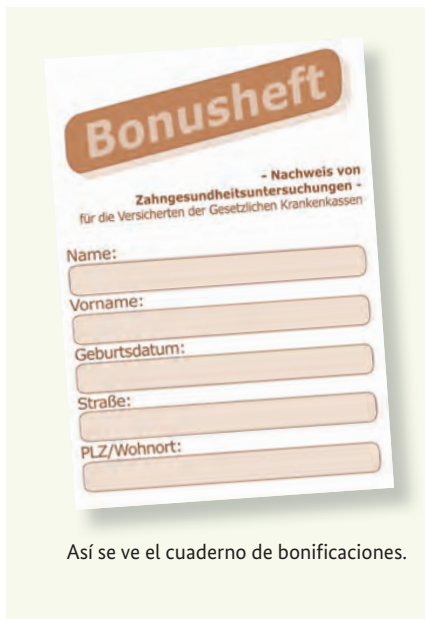
Así se ve el cuaderno de bonificaciones.

Unos dientes sanos suponen una buena calidad de vida. De ahí la importancia de las revisiones preventivas – aún cuando no tenga molestias. El seguro médico obligatorio cubre también estos exámenes preventivos. Estas revisiones tienen el fin de reconocer y tratar enfermedades dentales a tiempo. Para ello puede obtener un “cuaderno de bonificaciones” (Bonusheft) de su compañía de seguro médico, en el que se anotarán los exámenes preventivos. Si usted puede demostrar que ha acudido por lo menos una vez al año al dentista (para menores de edad como mínimo dos veces al año), su seguro médico le abonará una mayor cuantía cuando necesite prótesis dentales.