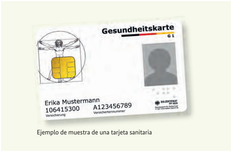
Ejemplo de muestra de una tarjeta sanitaria

Por favor, lleve siempre su tarjeta sanitaria electrónica (elektronische Gesundheitskarte) consigo cuando quiera recibir atención médica. Desde el 1 de enero de 2015 esta tarjeta constituye el único documento que acredita su derecho a recibir las prestaciones del seguro médico obligatorio. En la tarjeta sanitaria están registrados el nombre, la fecha de nacimiento, la dirección, el número de asegurado y el estado del asegurado (miembro, familiar o pensionado). Estos datos son obligatorios. La tarjeta sanitaria contiene además una fotografía en color.