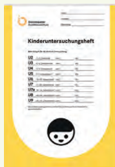
Así se ve el cuaderno de exámenes (U-Heft)

Estos exámenes son muy importantes. Acuda por lo tanto a todos ellos y lleve siempre consigo el cuaderno de exámenes (U-Heft) así como la cartilla de vacunas de su hijo/a. Estos exámenes son por la salud de su hijo/a