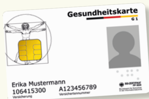
Exemplu model al unui card de sănătate

Va rugăm să aveți cardul electronic de sănătate permanent la dumneavoastră, când utilizați serviciile de sănătate. Începând cu 1 ianuarie 2015 acest card este exclusiv valabil ca dovadă de autorizare pentru a putea beneficia de serviciile asigurării de sănătate obligatorie. Pe cardul electronic de sănătate sunt salvate ca date obligatorii numele, data nașterii și adresa dumneavoastră cât și numărul dumneavoastră de asigurat medical și situația dumneavoastră de asigurat (membru, asigurat al familiei sau pensionar). Cardul electronic de sănătate conține și o fotografie cu dumneavoastră.